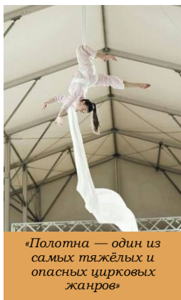
«Полотна — один из самых тяжёлых и опасных цирковых жанров»